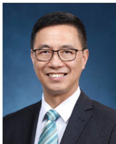
教育局局長楊潤雄

在此衷心感謝多位嘉賓講者、校長、教師、「商校合作計劃」伙伴機構代表及各界友好出席是次研討會，並深盼各方繼續攜手並肩，優化生涯規劃教育，培育社會棟樑。