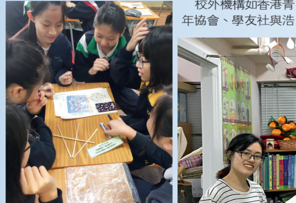
▲學生參與「MY WAY」生涯規劃課堂的趣味遊戲