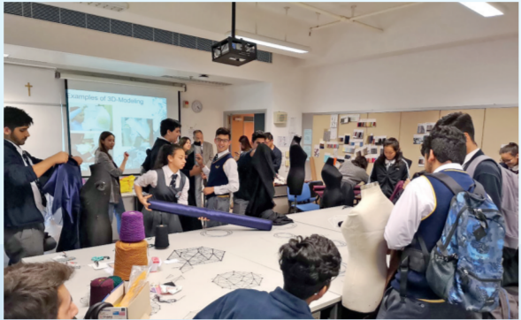
▲透過「政商學一帶一路小組」，進行大專模擬課堂。

千里之行始於足下，年輕人想有美好前程，就要及早作好生涯規劃，訂立人生目標。教育局非常重視對青年的培育工作，除了支援學校推行生涯規劃教育，更透過「商校合作計劃」推動社會各界和學校合作，為學生籌辦多元化的事業探索活動，幫助學生做好生涯規劃，為未來升學及投身社會做好準備。不少學校均充分運用本身的優勢，配合校情與學生的需要，透過生涯規劃活動，啟發和引導學生發展科創潛能，相關的成功的經驗值得大家參考和借鑑。 教育局將於11月13日舉辦「生涯規劃教育研討會」，邀請學校、教育界人士和「商校合作計劃」夥伴機構參與，集思廣益，互相交流，分享成果。本年度研討會的主題是「創意、創新、創未來」，幫助學生做好生涯規劃。