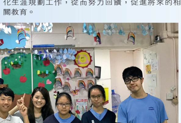
▲學生很珍惜可在「Tiny Feet 愛動園」體驗職場工作實況

▲全級中二學生分組到不同大學參觀，並邀請在相關院校就讀的校友充當「導遊」，沿途介紹校內環境和生活情況。