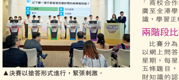
▲決賽以搶答形式進行，緊張刺激。

此外，升擇處着力推展生涯規劃課後小組及個人輔導，中三和中四的小組輔導分別針對課外事宜，檢視高中生涯適應情況；中六的個人諮詢輔導在今年疫下透過手機應用程式與放榜輔導專線進行。校本的生涯反思和升學擇業意願表，不但協助學生作個人反思，同時方便擇業分析佔估活動的成效。最後，升擇處善用外聯輔導提供的問卷調查，收集學生數據及意見，以便優化生涯規劃工作，從而努力回饋，促進將來的相關教育。