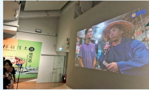
▲STEM大使協助補船滯天巨艦製作實地紀錄片，該影片亦儲于香港海事博物館展覽。

方每年舉辦參觀考察活動，帶領學生走訪企業、公營機構和政府部門，了解職場環境；另外，亦與商會和專業團體合作，為學生安排工作實習機會，讓他們汲取工作經驗。