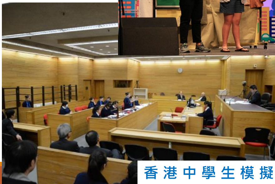
香港中學生模擬法庭比賽