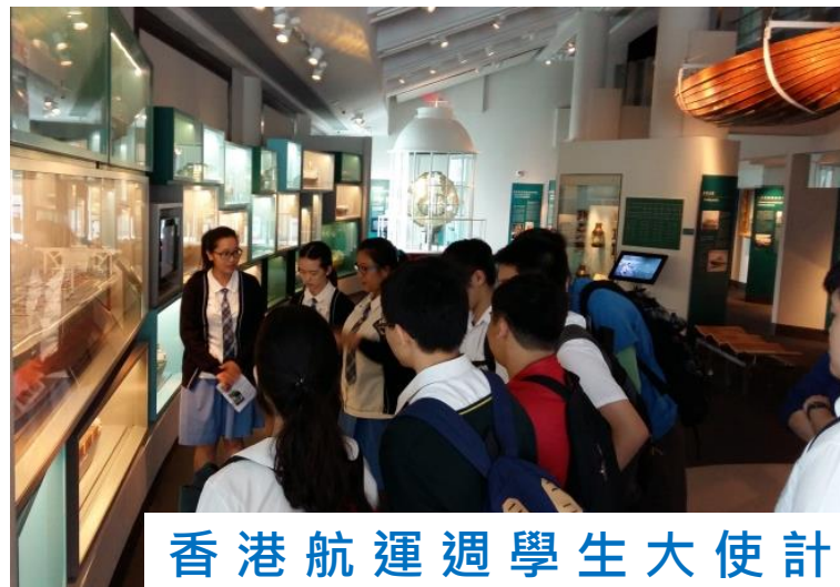
香港航運週學生大使計劃