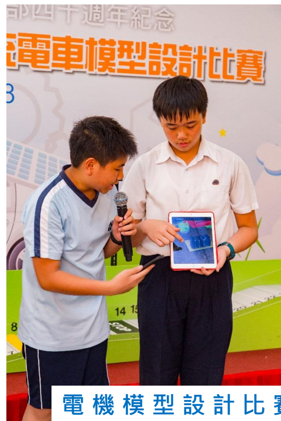
電機模型設計比賽