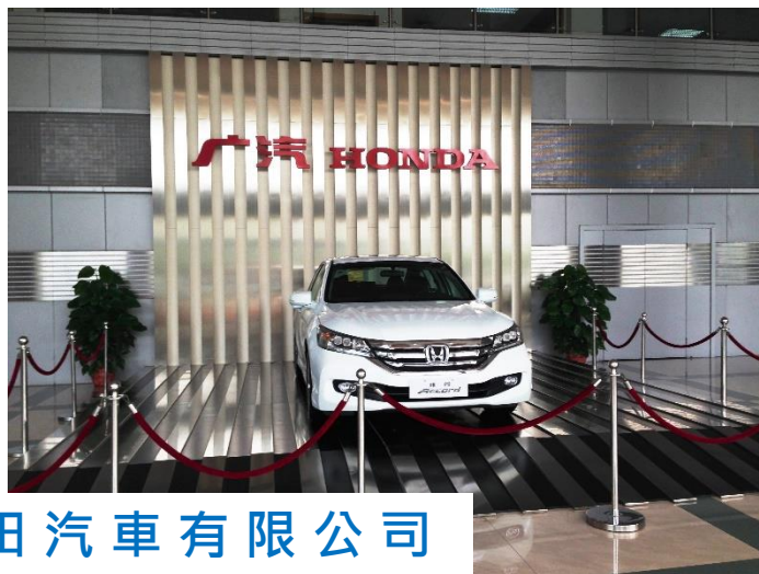
廣汽本田汽車有限公司