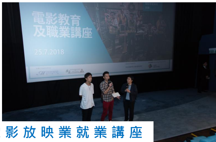
電影放映業就業講座