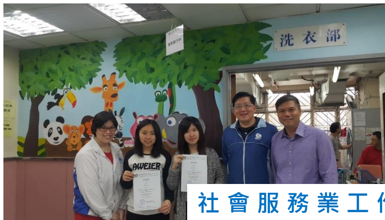
社會服務業工作體驗計劃