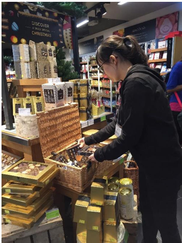
零售業工作體驗計劃