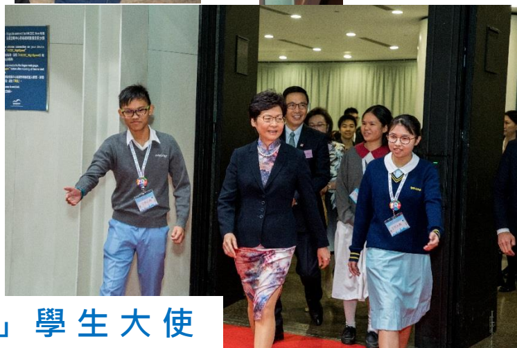
教育局「商校合作計劃」學生大使