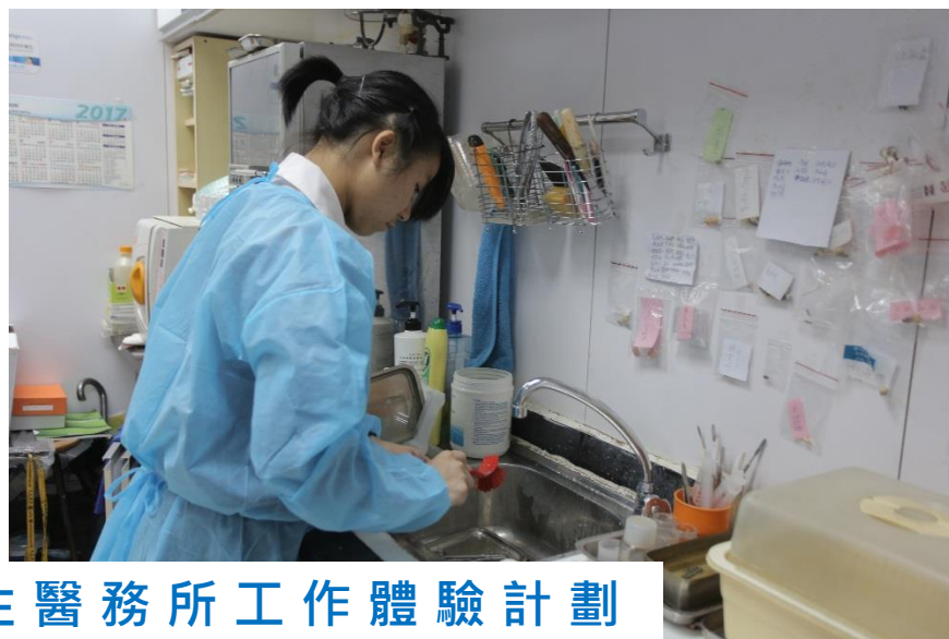
牙科醫生醫務所工作體驗計劃