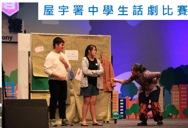
屋宇署中學生話劇比賽