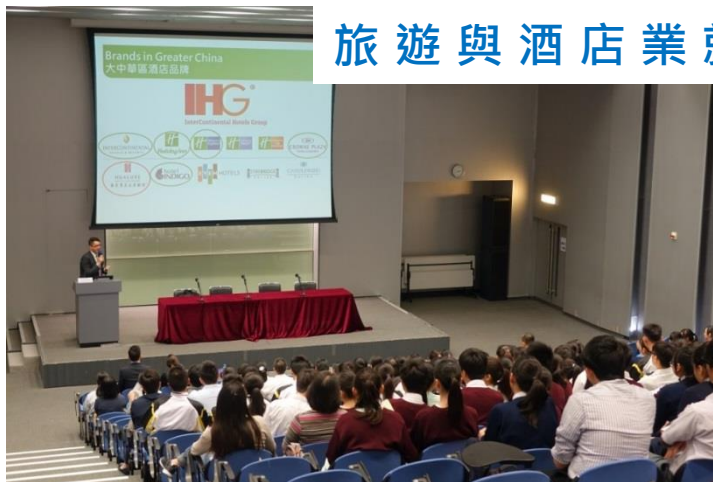
旅遊與酒店業就業講座