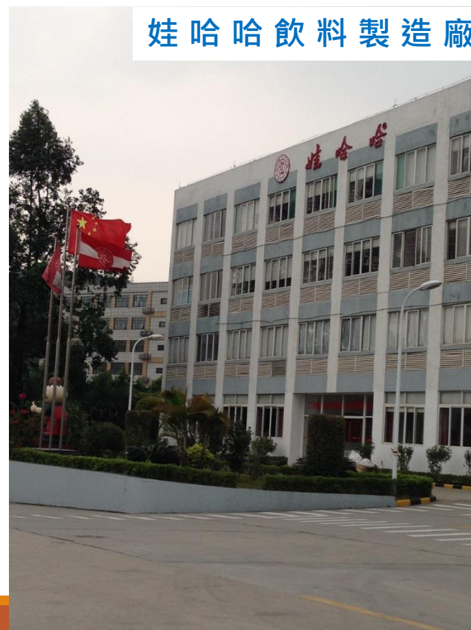
娃哈哈飲料製造廠