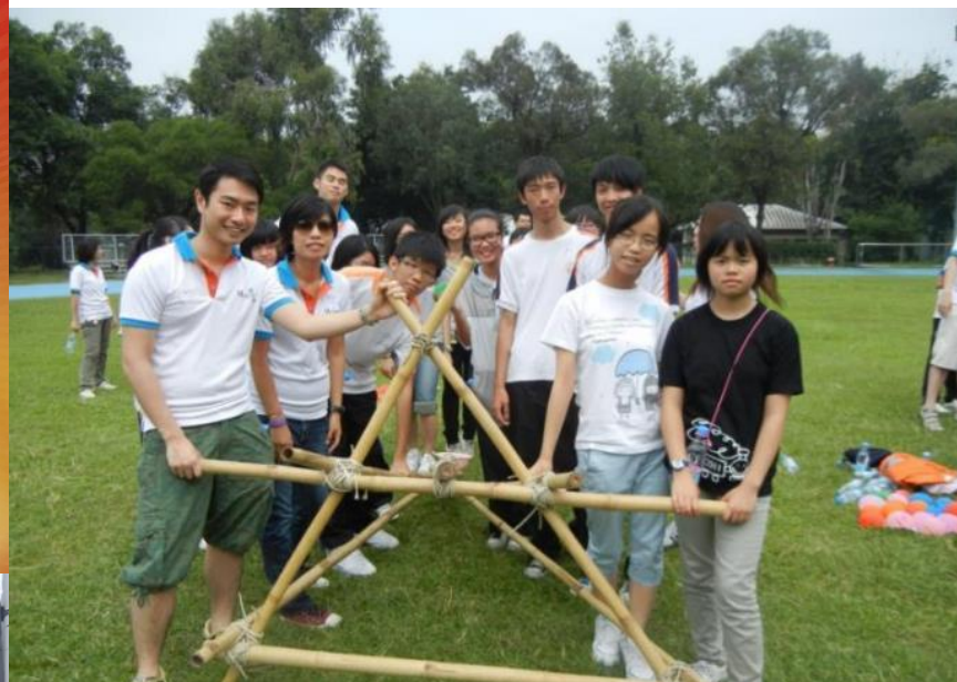
Teen使行動－ 青少年思健推廣計劃