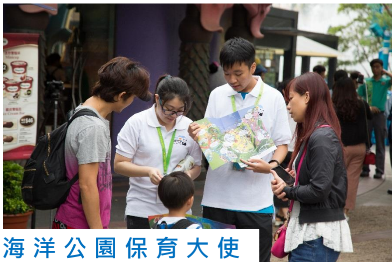
香港海洋公園保育大使