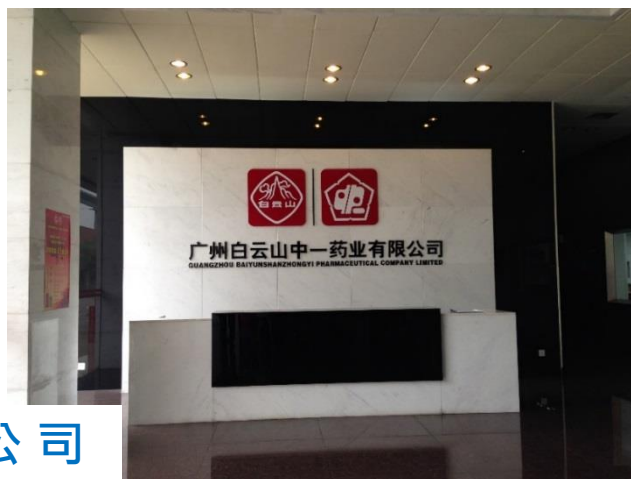
中一藥業有限公司